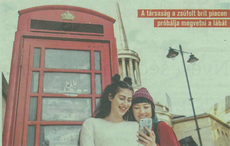
A társaság a zsúfolt brit piacon próbálja megvetni a lábát