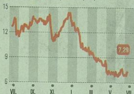
AZ AIR FRANCE-KLM ÁRFOLYAMA | 2017. július 10. ▶ 2018. július 10. (euro)

Az új vezérigazgató személye egyelőre kérdéses, ráadásul a légitársaság tulajdonosi köre is változhat, hisz az Accor SA szállodalánc érdekli az Air France-KLM legnagyobb