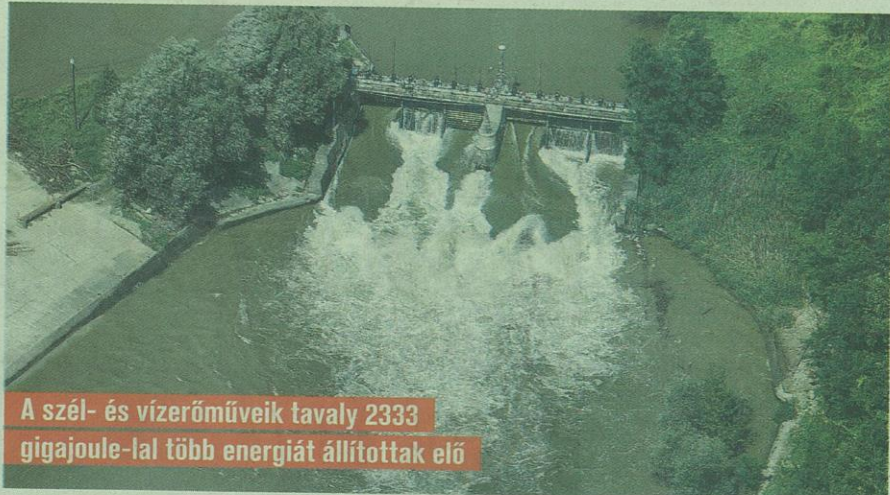
A szél- és vízerőműveik tavaly 2333 gigajoule-lal több energiát állítottak elő