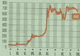
AZ OPUS GLOBAL ÁRFOLYAMA | 2017. január 2. ▶ 2018. július 10. (forint)

A korábban bejelentett június végi határidő helyett augusztus végén zárulnak le a tőkeemelések az Opus Globalnál. A társaság hat érdekeltiséget olvaszt magába, üzletretek apportjával közvetlen és közvetett tulajdont szerez a Mészáros Lőrinc, valamint a Status Energy Magántőkealap érdekeltségében lévő vállalatokban. A tranzakciók eredményeként az Opus saját tőkéje 75 milliárd forint fölé nőhet. A többlépcsős tranzakciósorozat lezárása a Budapesti Értéktőzsdén ko-