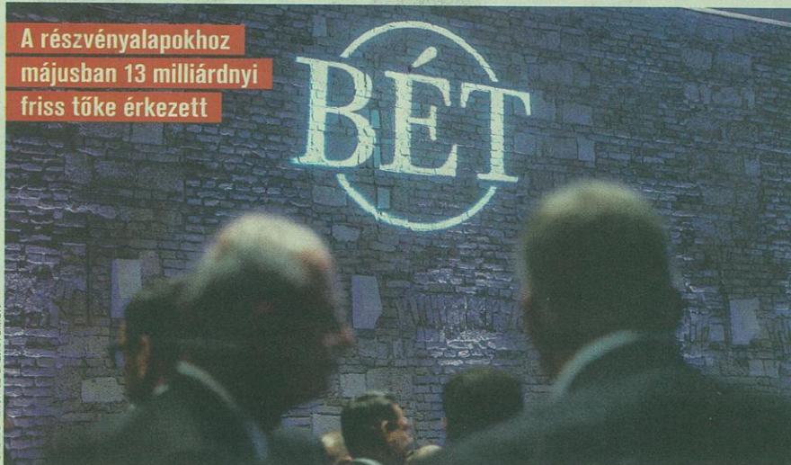
A részvényalapokhoz májusban 13 milliárdnyi friss tőke érkezett

KADLÓT TIBOR | Érdemi tőkebeáramlás nélkül is 94 milliárd forinttal gyarapodott a befektetési alapok vagyona a múlt hónapban. Az első fél évet 250 milliárd forintos veszteséggel zárták az alapok, s csak a vegyes kategória eszközértéke tudott gyarapodni.